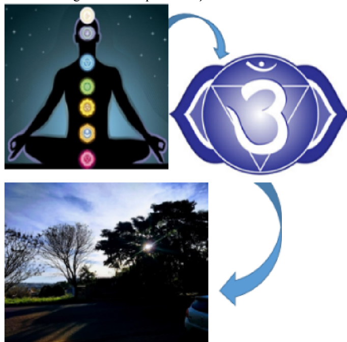
Figura 03 – Esquemática do Conceito

Outro ponto relevante para o trabalho é a escolha do lote, que traz uma vista deslumbrante, que se dá por estar em um dos pontos mais altos do município. Pode-se observar na Figura 03.